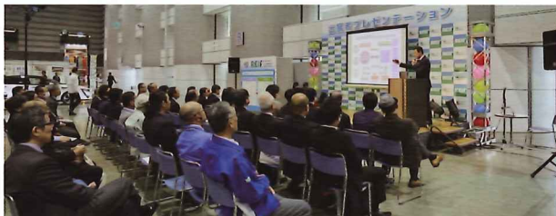
プレゼンテーションコーナー